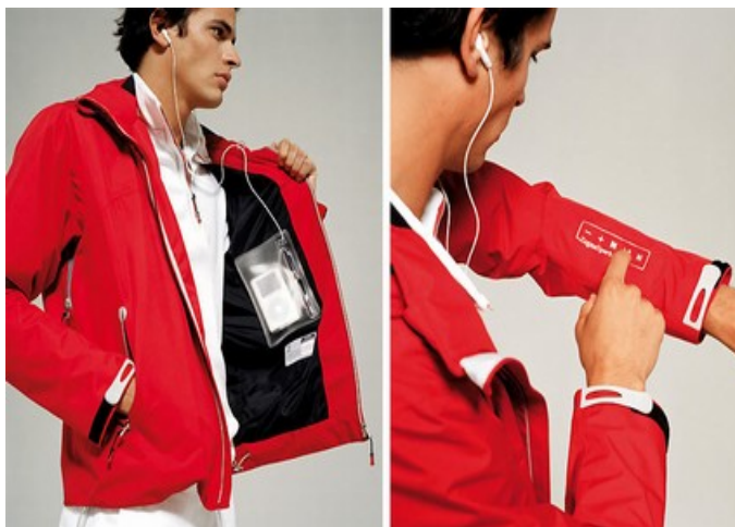
4.att. Ermenegildo Zegna Sport iJacket [11].

Tā, piemēram, ir radīts apģērbs MP3 atskaņotājam. Ermenegildo Zegna ir pasaulē pazīstams apģērba zīmols, kas izgatavojis iJacket sporta jaku vīriešiem, kura ir saderīga ar Apple iPod MP3 mūzikas atskaņotājiem (sk. 4.att.). Jakas lietotājs var piekļūt MP3 atskaņotājam caur auduma tastatūru [6].