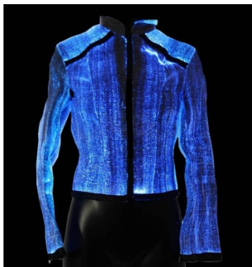
5.att. Jaka ar optiskām šķiedrām „Lumigram’s” [13].

var panākt, integrējot tekstila struktūrā optiskās šķiedras (sk. 5.att.) vai apģērbā (tekstilā) LED 2 diodes (sk. 6.att.).