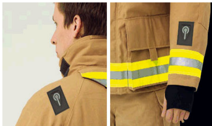
1.att. Viedais apģērbs profesionālām vajadzībām. Viking firmas ugunsdzēsēja tērps paziņo ugunsdzēsējam par jebkuru kritiski karsto punktu tērpā [8].

Viedo funkciju integrēšana apģērbā un citās tekstilprecēs radikāli izmainīs kultūru ap šiem produktiem, kā arī korelēs cilvēku attiecības ar tiem un to, kā viņi tos lieto. Viedās funkcijas var būtiski ietekmēt tekstilmateriālu sortimentu un apģērba dizainu [7].