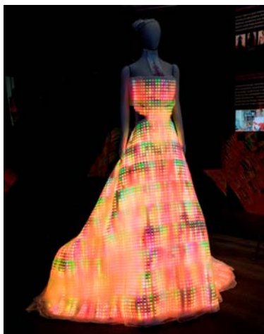
2.att. Kleita ar LED diodēm „The Galaxy Dress” CuteCircuit [9].

Viedajam apģērbam kļūstot par tirgus preci, galvenā uzmanība tiek pievērsta tā tehniskajām īpašībām un ne vienmēr tiek ņemtas vērā apģērba estētiskās īpašības. Tehnisko komponentu integrācija apģērbā ir nepilnīga daļēji arī tādēļ, ka pašas tehniskās sistēmas un detaļas kopumā mēdz būt samērā liela izmēra, lai saglabātu apģērba estētiskās funkcijas, kā arī inženieru nepietiekamās zināšanas aktuālākajos modes jautājumos. Tajā pašā laikā pieejamās tehnoloģijas iespaido modes dizainerus tādu apģērbu veidošanā, kas pārsvarā nav pielietojami ikdienā (2. att. un 3.att.).