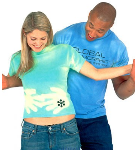
7.att. Uzņēmums Wenzhou Coloroyal Technology Co., Ltd.

Pašlaik viedajā apģērbā tiek izmantoti arī krāsu mainošie materiāli. Šie materiāli - pazīstami kā „hameleoni” - maina krāsu atbilstoši ārējās vides izmaiņām (piem., termohromotiski materiāli). Tie maina savu krāsu, mainoties temperatūrai apkārtējā vidē (7.att.), kā arī var būt apvienoti ar materiālu vai ierīci, kas var mehāniski siltināt materiālu, ļaujot lietotājam pašam vadīt materiālu krāsu maiņu atkarībā no viņa vēlmēm, mainot temperatūru ar sildelementa (speciālā materiāla vai ierīces) palīdzību [6].