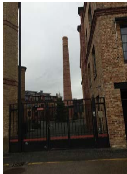
4. att. Bijušās firmas “Paul Boehm” krīta un ģipša fabrikas skurstenis un pagalmus Ķīpsalā mūsdienās.