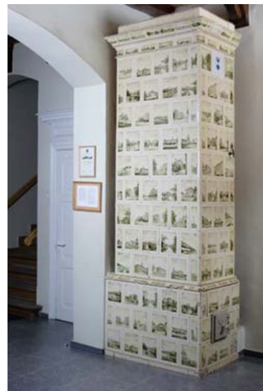
2. att. Firmas “Zelm & Boehm” izgatavotā podiņu krāsns Jaunmoku pilī.