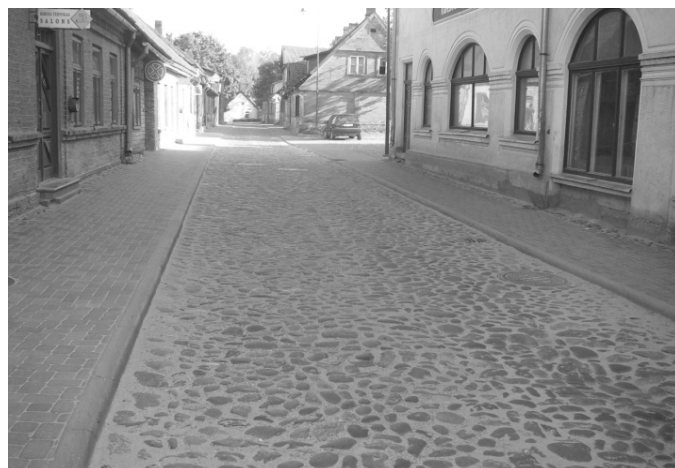
5. att. Rekonstruēta Raiņa iela Kuldīgā – atjaunots akmens bruģa segums [7].