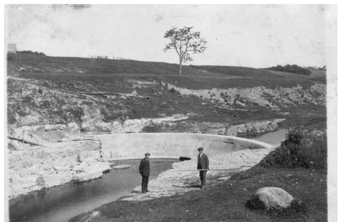
2. att. Skats uz Mārtiņsalu 20.gs. sākumā – bez apauguma [7].

Koki aug pārāk tuvu ēkām, tās noēno, ar saknēm izcīlā pamatus, bieži vien, lūstot bojā jumta konstrukcijas, segumu. Visbiežāk tie ir pašsējā ieauguši koki, kurus īpašnieki neizrāva, bet lielus neatļauj zāgēt pilsētu vides un ainavu speciālisti, norādot, ka koks konkrētā ainavā labi iederas. Lai ēka neciestu no koku ietekmes, apmēram 5 m no ēkas nevajadzētu augt lieliem kokiem. Bieži vien ir jāizvēlas: koks, kas iespējams konkrētā vietā nav stādīts, vai ēka, kura celta konkrētā vietā un saglabājusies vairākus gadsimtus!