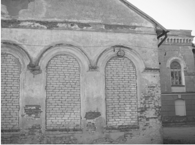
7. att. Kuldīgas sinagogas kompleksa ēka – pielāgota garāžas vajadzībām [7].

sinagogas ēku kompleksā ēkas pielāgotas garāžas vajadzībām, pielietojot silikātkieģeļus un cementa javu – vecpilsētai neraksturīgus materiālus, skatīt 7. att. Vecpilsētā būvniecībā un labiekārtojuma elementos netika pielietots koks, jo koku uzskatīja par īslaicīgu materiālu.