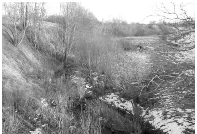
3. att. Skats uz Mārtiņsalu 2010. gadā – ar kokaugu apaugumu [7].