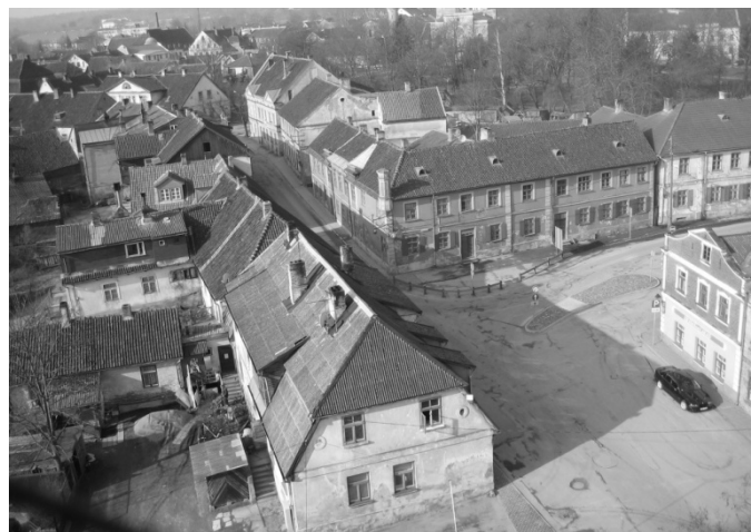
4. att. Azbestcementsa jumtu segumi Kuldīgas vecpilsētas jumtu ainavā, kuras vērtība ir amatnieciski darinātu māla kārņiņu jumtu segumi [7].

padomju laika silikātkieģeļu ēkas mērogu padarītu viedī atbilstošu, deviņdesmitajos gados mēģināts pielietot dažādus elementus: vienkārtas piebūvi ēkas priekšpagalmā, noslēdzošu stūra apjomu, skatīt 6.att.