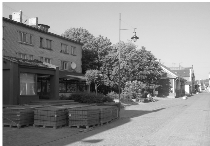
6. att. Ēka Liepājas ielā 19 - padomju laika uzslāņojums [7].

Vecpilsētas pagalmos tika uzcelti šķūņi un garāžas no silikātkieģeļiem, kuru vietās nojauktas koka ēkas. Kuldīgas