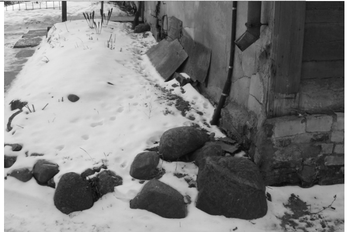
1.att. Ēkas pamatus bojā pārāk augstu izvietotas notekrenes [7].

Kuldīgas vēsturiskā centra vērtību veido ainava, kurā saglabājušās liecības gan par cilvēka iecerēm pārveidot dabu, gan dažādus laikmetus raksturojoši kultūrvēsturiskie objekti. Kultūrvēsturiskajam mantojumam ir liela nozīme Kuldīgas pilsētas identitātes un īpašā rakstura veidošanā.