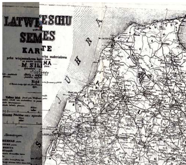
3.att. Latviešu apdzīvotās zemes kartes fragments.

Bet, kā liecina valsts vadošo speciālistu publikācijas par Latvijas kartogrāfiju, M.Siliņa vārds vispār netika minēts [9]. Tūlīt pēc valstiskās neatkarības atjaunošanas Latvijas Kultūras fondam tika rosināts izdot M.Siliņa galveno kartogrāfisko darbu faksimilus. Diemžēl atbalsts šai idejai netika saņemts.