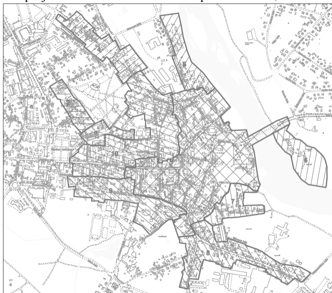
2.att. Kuldīgas pilsētas vēsturiskās apbūves zonas [4].