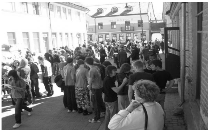
5.att. UNESCO spēle jauniešiem Kuldīgas vecpilsētā.