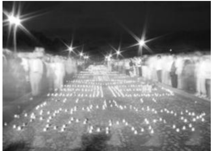
6.att. Akcija Gaismas tilti 2008.g. Uz tikko restaurētā ķieģeļu tilta.