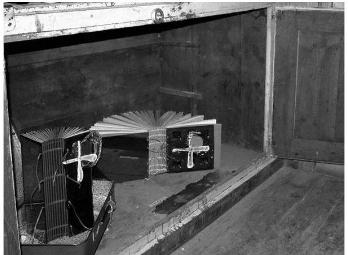
7.att. Mākslas dienas 2008 – izstāde vēsturiskas ēkas kāpņu telpā – zviedru lāde kā ekspozīcijas vieta.