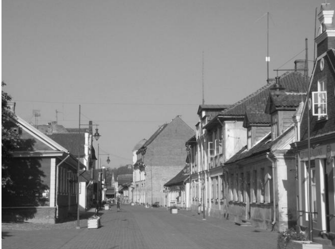
3.att. Liepājas iela Kuldīgas vecpilsētā.