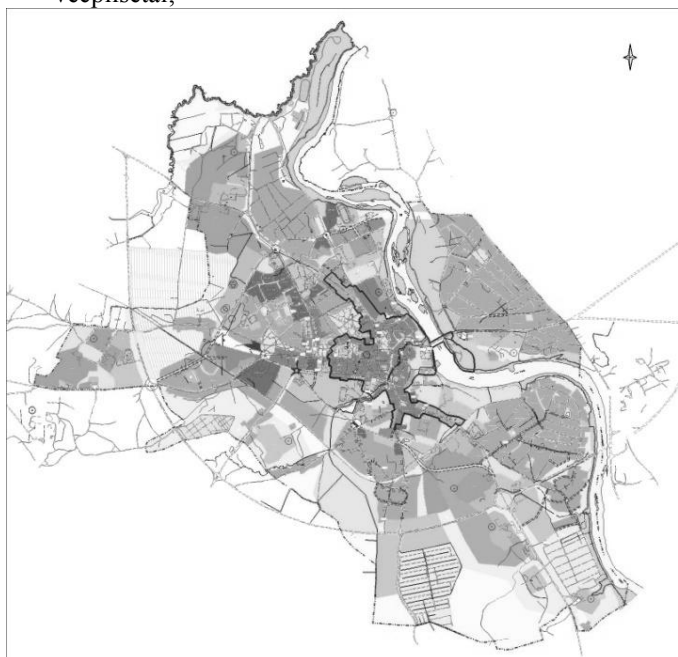
1.att. Kuldīgas pilsētas teritorijas plānojuma plānotās un atļautās izmantošanas karte. Sarkanā līnija norāda Kuldīgas vecpilsētas robežu [4].