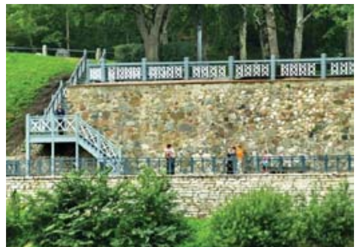
Fig. 14 and 15. Elements of town environment – supporting wall of Venta riverside – functional transformation providing recreational terrace.