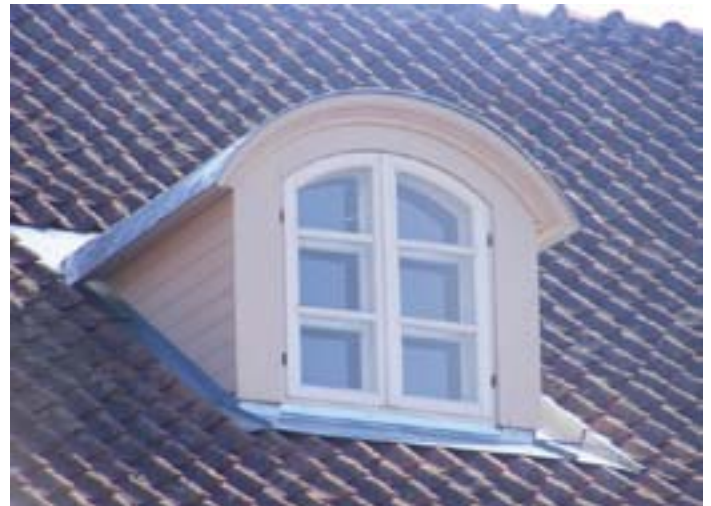
Fig. 6 and 7. On the left – roof building does not respond to historical environment. On the right – building responds to environment.