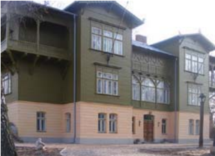
Fig. 3. Kuldīga municipality museum renovated according with conservation principles of historical buildings. In accordance with building terminology – restored building.