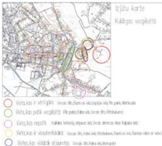
Fig. 5. Map of feeling, what shows (according to the opinions of inhabitants) most valuable, pleasant, unpleasant, authentic and best renovated places in the old town. [4]