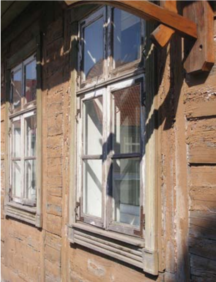
Fig. 8. Improvement of window energy efficiency: replacement of inside wooden frame with plastic frame and double glazed units. Inside sash is without split and with wide part of frame, without profiling – that does not fit to historical wooden building facade overview.

It should not be promoted to extend the buildings in historical environment, where the main values are planning, buildings, which are preserved from the beginning of 19 th century and its backyards, because that would destroy historical and traditional