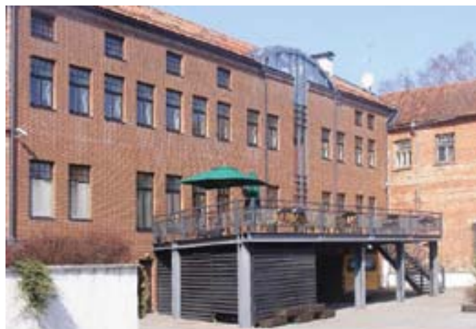
Fig. 1 and 2. Hotel “Metropole” – from the point of Kuldīga inhabitants, the best renovated building in old town. In accordance with building terminology – renovated building.