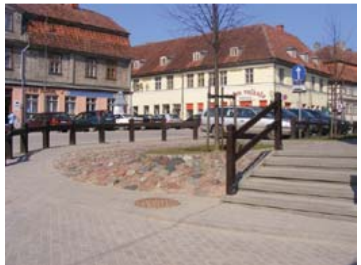
Fig. 13. Convex ramp (on the left) provides accessibility to the places of different levels, at the same time it is an element that fits into the old town environment.