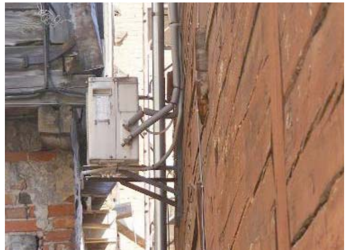
Fig. 12. Cooling device next to historical gallery type shed where café is situated.