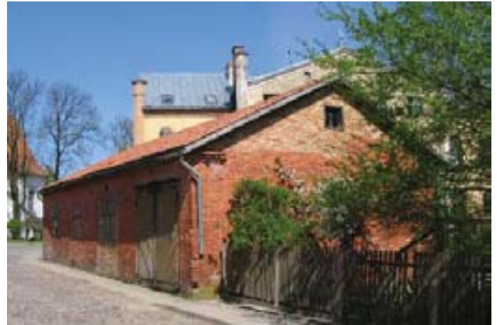
Fig. 11. Historical depot, what will be rebuilt for administrative use, to avoid building outbuilding to town hall (in background).

former owners had no money to renovate and replace. If they find finances, according to owners, building has to be renovated in modern style. Interests of owners meet requirements of cultural