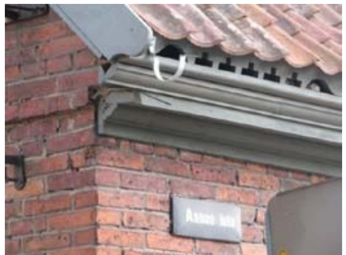
Fig. 9 and 10. On the left – insulated building, where instead of cornice is constructed “wind box”. On the right – cornice with jagged band peculiar to Kuldīga old town. Buildings can be insulated only from inside not to lose cornice solutions and brick elements.